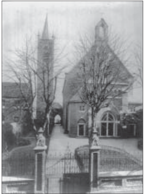
von 1922 bis 1943

Bei der ersten gemeinsamen Sitzung redete dann der Presbyteriumsvorsitzende den Anwesenden ins Gewissen mit der Frage, ob „wir den Kirchbau mit ‘reinen Händen’ betreiben, d.h., ob Gemeinde, Presbyterium und Kirchbauverein... sich immer dessen be-