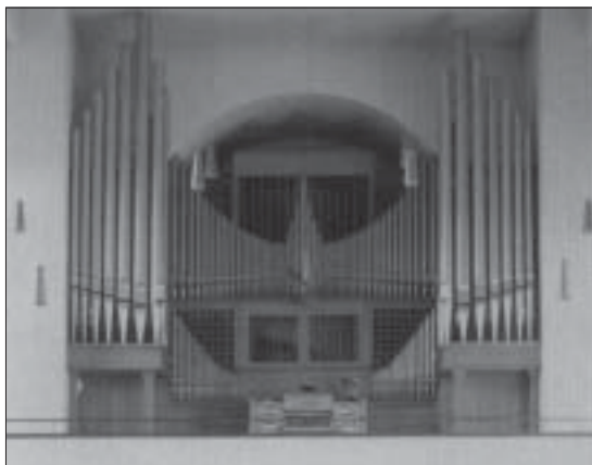
1967 bis heute

Orgelneubau durch die Firma Emil Hammer, Hannover. 42 Register, verteilt auf Positiv (I. Manual), Hauptwerk (II. Manual), Schwellwerk (III. Manual), Brustwerk (IV. Manual) und Pedalwerk. Die einzelnen Werke sind am freistehenden Prospekt deutlich ablesbar: die beiden kleinen Pfeifenfelder rechts und links unten zeigen das Positiv, das große Pfeifenfeld darüber das Hauptwerk. Über diesem Pfeifenfeld steht oben in der Mitte das Schwellwerk (im Gehäuse), unter dem Pfeifenfeld in der Mitte das Brustwerk (im Gehäuse). Rechts und links stehen die beiden großen Pfeifentürme des Pedalwerks.