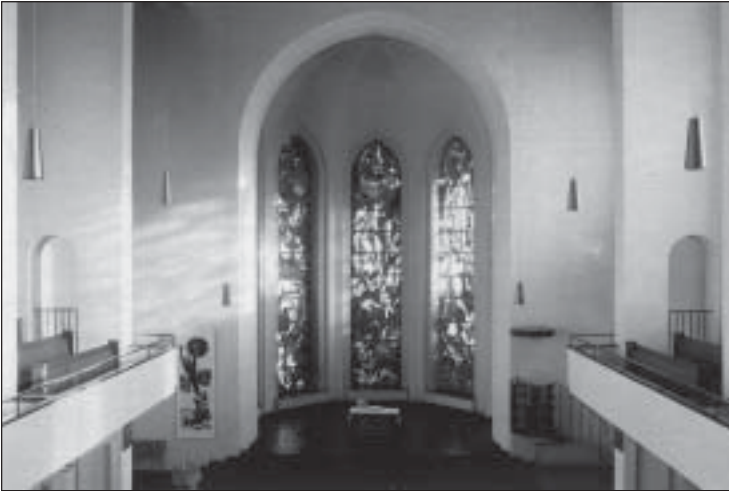
von 1966 bis 1994