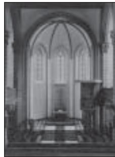
von 1922 bis 1943

Erneute Erörterung der Innenraumgestaltung im Sinne einer modernen Lösung, die aber dem Stil der ursprünglich neugotischen Hallenkirche gerecht wird: Herausnahme der Emporen, Rundbogendecke, Stahlbetonsäulen statt Wandpfeiler, Begradigung der Orgelempore. Umbau in vier oder mehreren Bauabschnitten. Bei Bedarf könnten Emporen später wieder eingebaut werden.