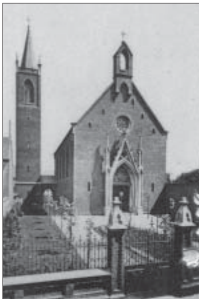
1852 bis 1922

„Heute, den 28ten Oktober 1852 wurde die neue evangelische Kirche hiesiger Gemeinde durch den Hh. General-Superintendenten Schmidborn kirchenordnungsmäßig eingeweiht.“