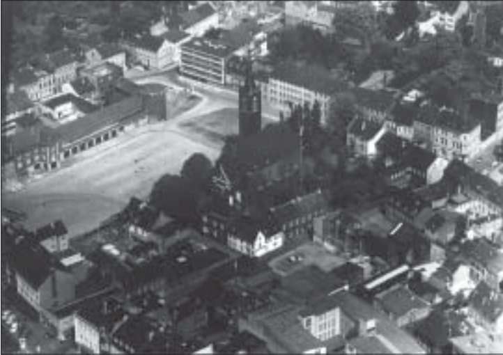
Die Christuskirche in den 60er Jahren