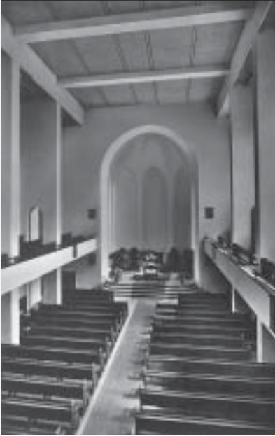
von 1951 bis 1962