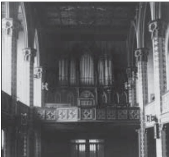
1922 bis 1943